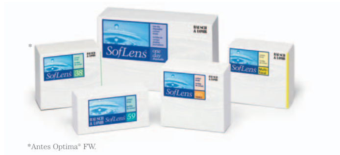
*Antes Optima® FW.

Desde lentes de uso diario desechables o que se reemplazan cada dos semanas, hasta lentes de uso continuo. Bausch & Lomb ofrece lentes de contacto blandos que se adaptan a cada estilo de vida y a cada necesidad de corrección de la visión. Ahora puedes tener una visión clara sin necesidad de anteojos.